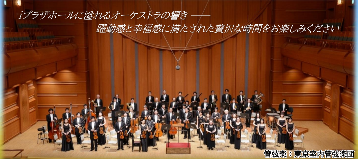
管弦楽：東京室内管弦楽団