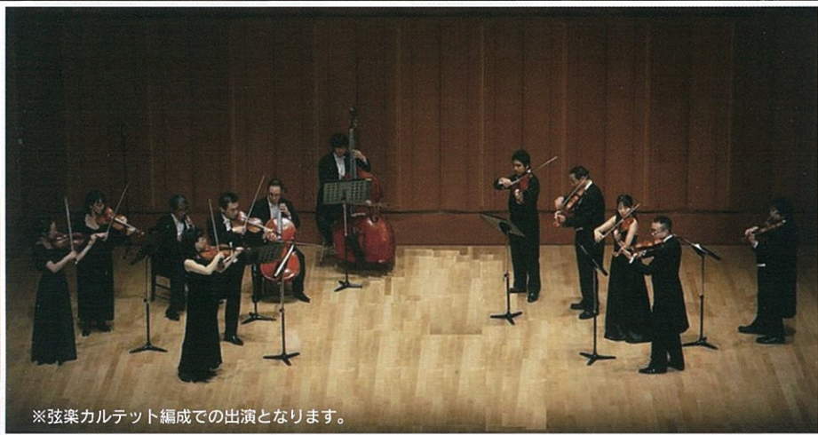
※弦楽カルテット編成での出演となります。

平成30年 12月8日(土) 開場 13:30 開演 14:00 水俣市文化会館 水俣市牧ノ内8-1